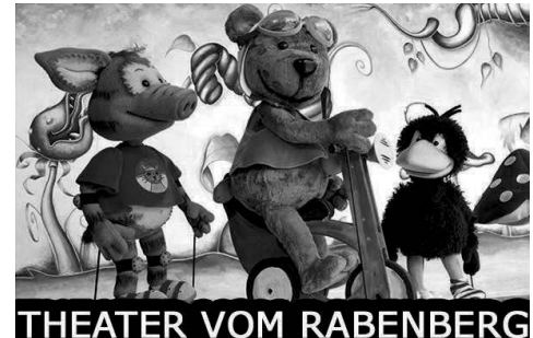
THEATER VOM RABENBERG

Eintritt: Kinder 7,50 Euro, Erwachsene 9 Euro, Familienkarte für 1-2 Erwachsene und 2 Kinder 20 Euro, jedes weitere Kind 3 Euro.